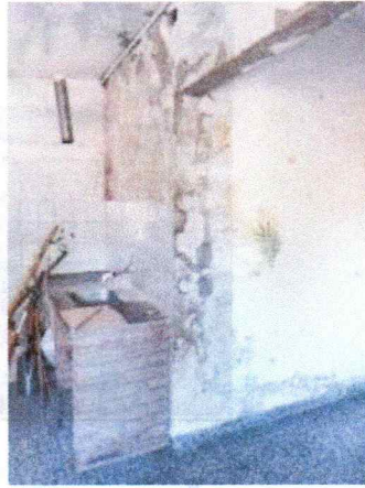
Así encontramos el edificio